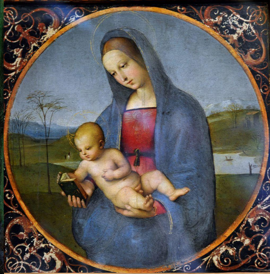
Рафаэль - Мадонна Конестабиле (Санкт-Петербург, Эрмитаж)