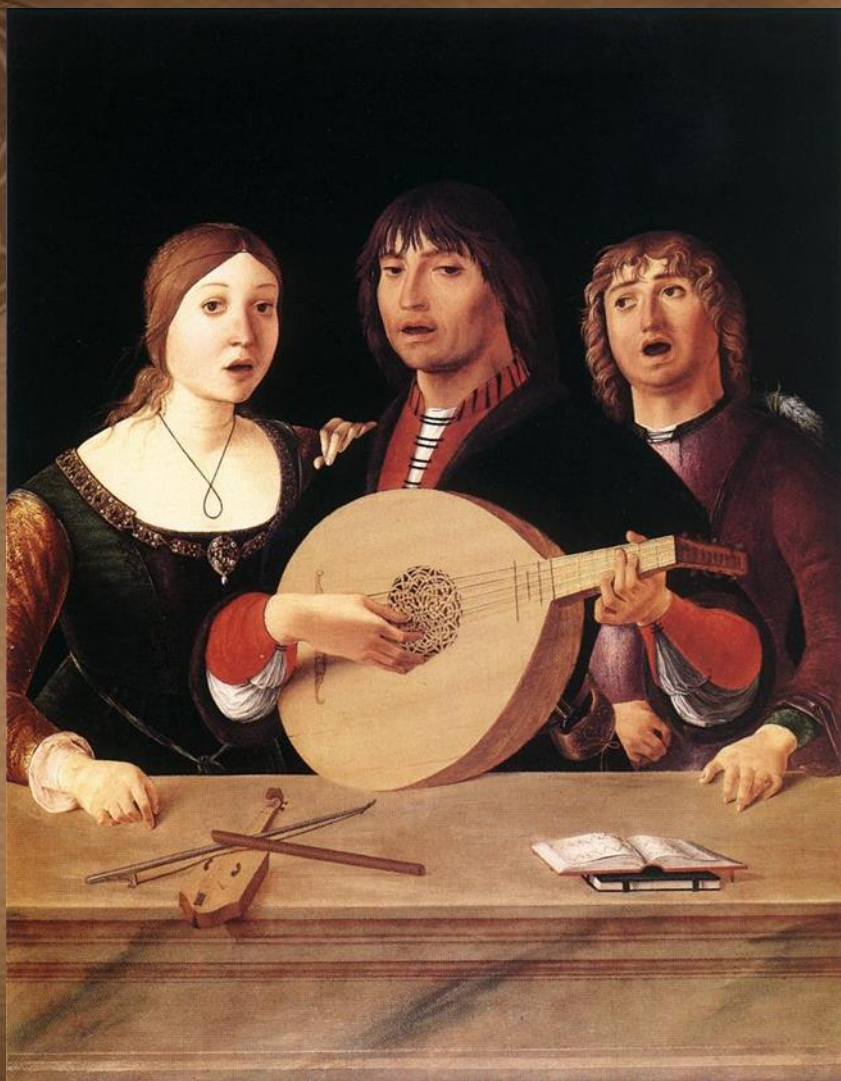
Лоренцо Коста. Концерт. ок. 1485 -1495 гг.