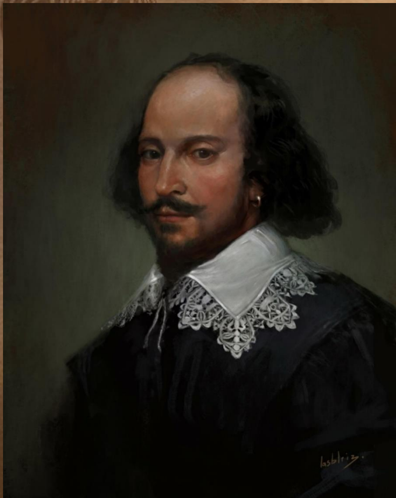
Уильям Шекспир (1564 – 1616)