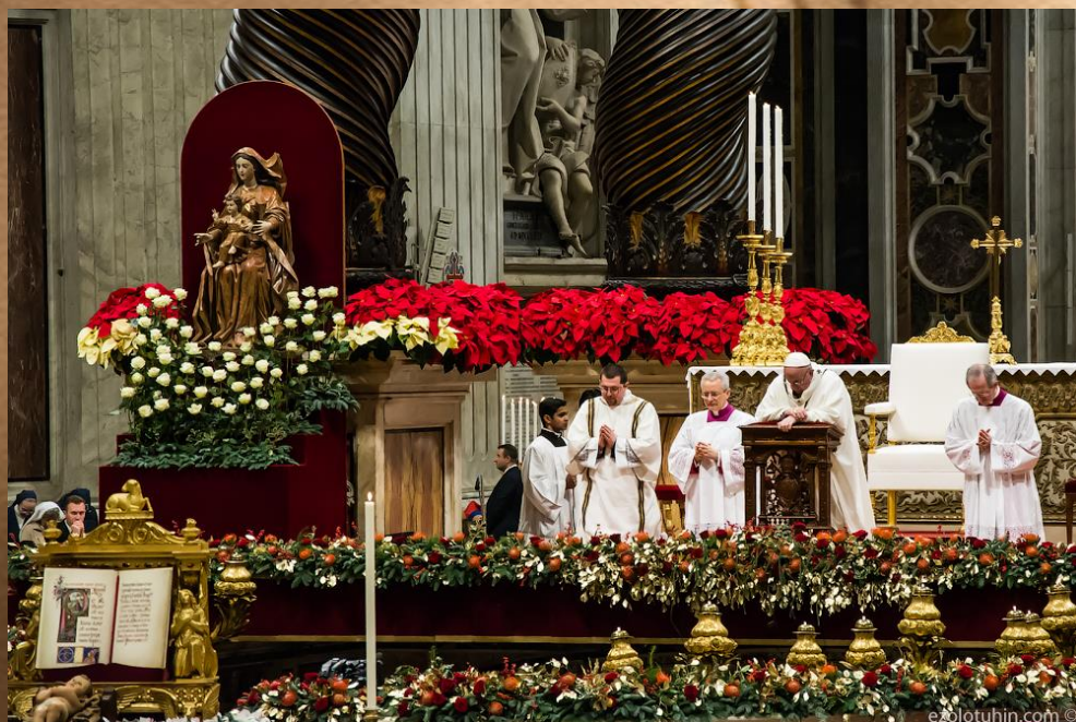
Рождественская месса в Ватикане с Папой Римским

В церковной музыке продолжают бытовать жанры эпохи Средневековья, но самым распространенным является месса. Месса к этому времени как музыкальный жанр сложилась в виде циклического вокального или вокально-инструментального произведения на текст главного богослужения католической церкви.