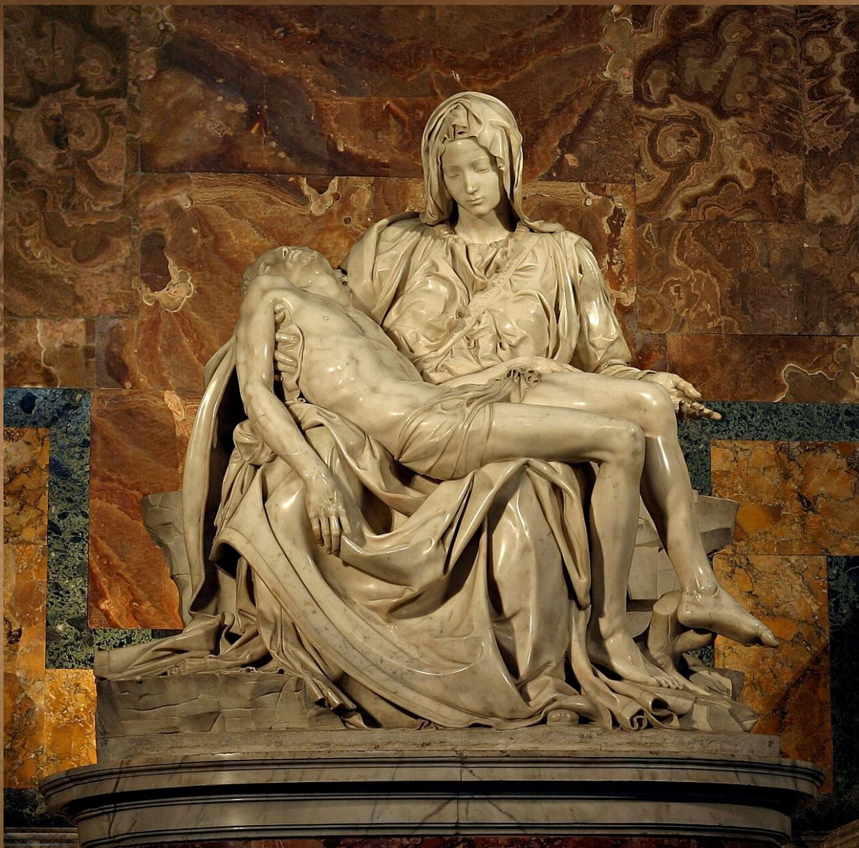
Микеланджело «Оплакивание Христа» («Пьета»)