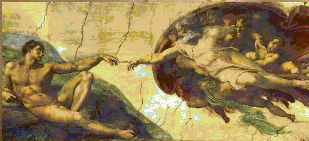
Микеланджело фреска «Сотворение Адама»

Гуманизм - (от лат. Humanus человеческий, человечный), признание ценности человека как личности, его права на свободное развитие и проявление своих способностей, утверждение блага человека как критерия оценки общественных отношений.