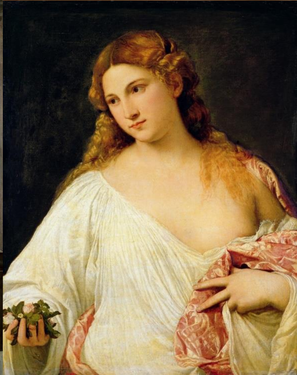
Тициан – Флора