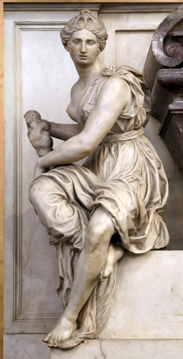
Баттиста дель Кавальере «Муза живописи»