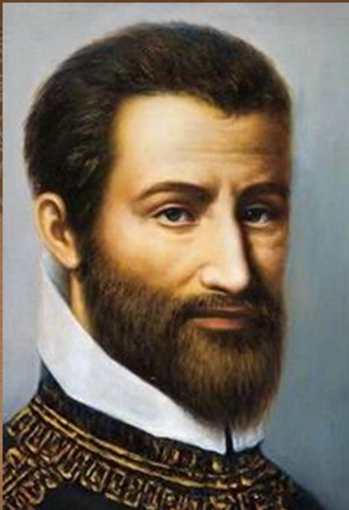
Джованни Пърлуиджи да Палестрина (1525 - 1594)