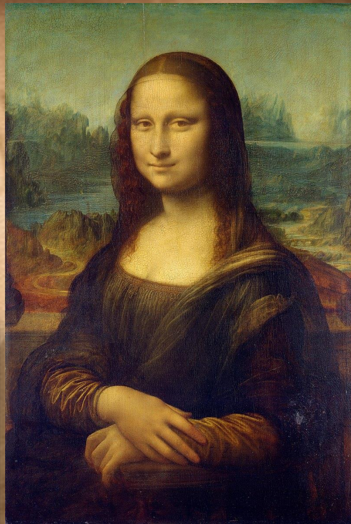
Леонардо да Винчи «Мона Лиза»